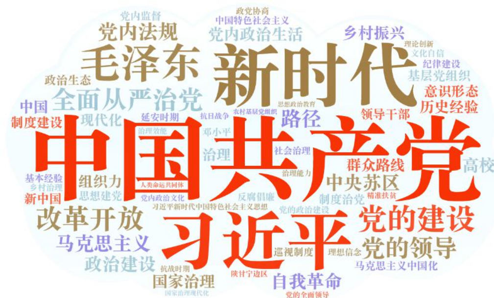
图 4 国家社科基金党史党建类项目产出期刊论文热点词云图

对 2016-2020 年国家社科基金项目资助的 1829 篇文献的 4062 个关键词进行词频统计，大于 10 的关键词有 61 个，热点关键词详见图 4。