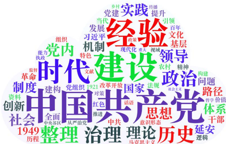
图 2 国家社科基金党史党建类项目名称热点词云图

2016-2020 年国家社科基金党史党建类 645 个项目中共包含 1000 个词语，其中词频数大于 10 的有 70 个，如图 2 所示。